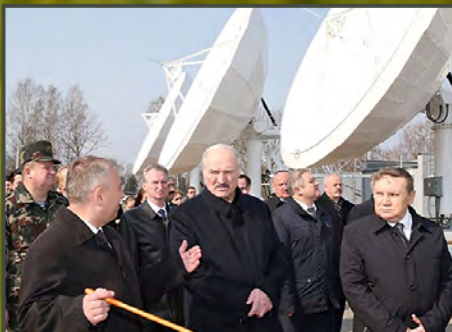
РУП «ЗАВОД ТОЧНОЙ ЭЛЕКТРОМЕХАНИКИ»