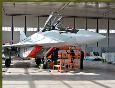
ОАО «558 АРЗ»

KADEX-2016: НОВАЦИИ ОТ ОБОРОНКИ KADEX 2016: DEFENCE INNOVATIONS