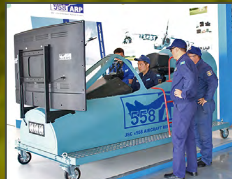
ВЫСТАВКА KADEX -2016

ВОЕННО-ПРОМЫШЛЕННЫЙ КОМПЛЕКС. БЕЛАРУСЬ | MILITARY-INDUSTRIAL COMPLEX. BELARUS | ВОЕННО-ПРОМЫШЛЕННЫЙ КОМПЛЕКС. БЕЛАРУСЬ | MILITARY-INDUSTRIAL COMPLEX. BELARUS